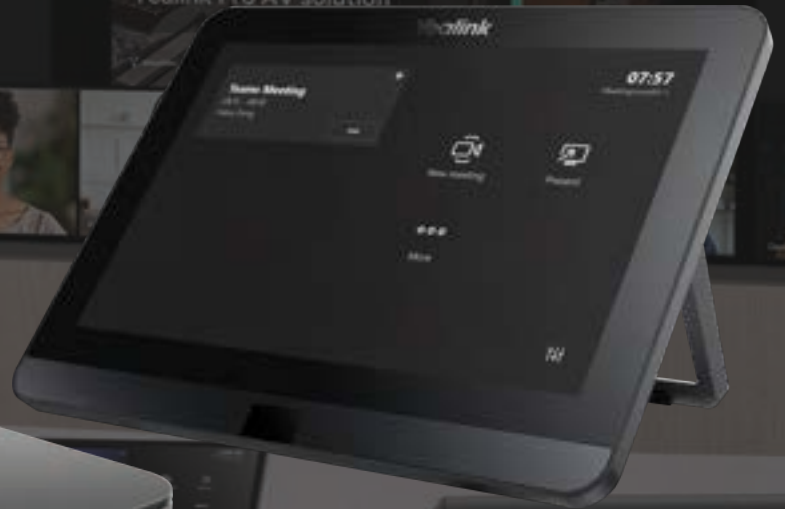
MTouch E2 Touch Panel